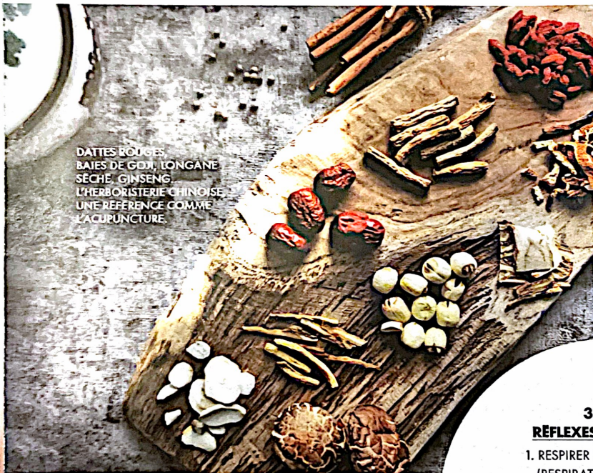
DATTES ROUGES BAIES DE GOJI, LONGANE SÈCHE, GINSENG, L'HERBORISTERIE CHINOISE UNE RÉFÉRENCE COMME L'ACUPUNCTURE